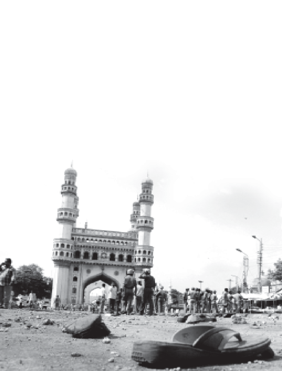
ഇന്ത്യയിലെ ഭീകരാക്രമണങ്ങളും ഉത്തരം കിട്ടാത്ത ചോദ്യങ്ങളും